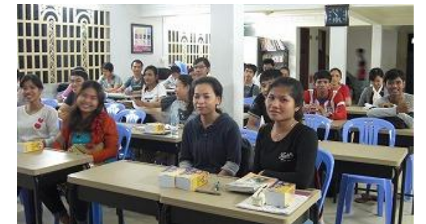
今年度は昼間部に過去最多の 235 名の学生の入学を受け入れられました。教室が足りず、共有スペースも利用して授業を行っています