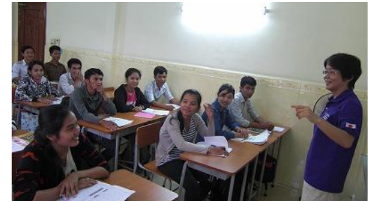
CBTC の日本語の授業風景(初級クラス)。日本からベテランの日本語教師を派遣し、生きた日本語を教えています

*2012 年 10 月に Cambodia Japan Business School(CJBS)から改称しました