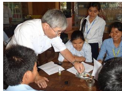
カンボジアで活動する「国境なき教師団」の教育アドバイザー

まずは、教育関連事業を行っている企業の方にインタビューを行い、学校とは違う角度で日本の教育における課題を伺ってみます。また、ご紹介する先は、教育関連企業の中でも社会貢献に力を入れている点に注目し、取材のお願いをした企業です。