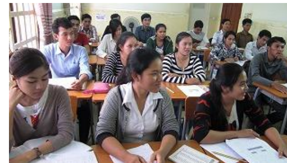
学生のレベルによって初級から上級まで複数のクラスに分かれ日本語検定試験の合格をめざします。昼間部と夜間部があります