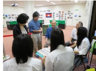
「国境なき教師団」応援団の先生の引率で教科書展を見に来た岐阜の高校生