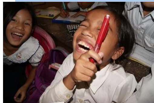
CIESF の支援活動は寄付で成り立っています。皆さまのあたたかいお気持ちをお待ちしております。

※ゆうちょ銀行、楽天銀行、クレジットカードでの寄付については、CIESF ホームページをご覧ください。