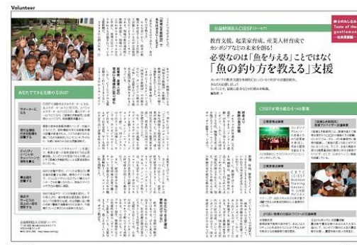
掲載いただいた 6 月号の記事