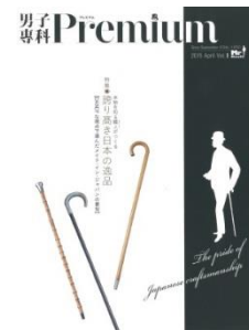
男子専科 Premium 4 月号表紙

昭和 25 年(1950 年)『スタイル』の臨時増刊号として産声をあげた『男子専科』が 20 年もの休刊を経て『男子専科 Premium』として復刊し、6 月号に、CIESF をご紹介いただきました。株式会社男子専科社長の山崎伸治氏は、CIESF のサポーターとして長年にわたってご支援くださっています。より多くの紳士の方々にご覧いただけると嬉しいです。ありがとうございました。