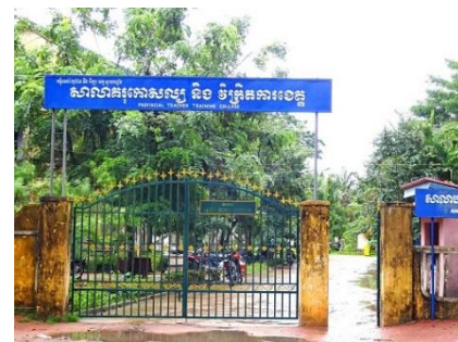
スバイリエン州小学校教員養成校の校門

CIESF では、2009 年より「国境なき教師団」として、カンボジアの教員養成校に理数科の教育アドバイザーを派遣しています。2015 年 7 月末時点で、延べ 22 名の教師を派遣してきました。全員が、定年退職後「自分の教師としての経験を活かしてカンボジアの教師育成に貢献したい」というベテランのボランティアです。教員養成校の教官をカウンターパートに、教官のレベルアップによる教員養成の、そして教育全体のレベルアップを目指しています。