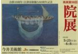
今井美術館のホスター。CIESFへの寄付についての告知もされています

法人サポーターの今井産業株式会社様(鳥根県江津市)は、今井美術館の入館料の一部をCIESFの教育支援への寄付としてくださっています。