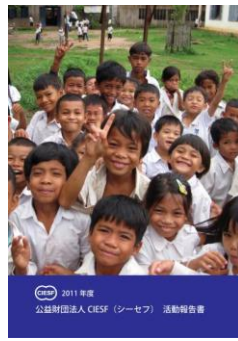
2011年度 公益財団法人CIESF(シーセフ) 活動報告書

に広く活動ができましたのも、ご支援くださる皆さまのおかげです。また、この報告書は、法人サポーターである株式会社オカモト印刷様(東京都杉並区)のご支援で印刷をさせていただきました。お礼申し上げます。この場を借りてあらためてお礼申し上げます。