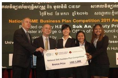
2012年1月に開催されたカンボジアでの第2回ビジネスプランコンテストの表彰式(2位のチーム)

最終選考会&表彰式予定 カンボジア 2013年1月 ミャンマー (T) 2012年10月 ミャンマー (一般事業) 11月9日 年々盛り上がりを見せています。スポンサーはウチサイトや会場で紹介させていただくだけでなく、法人の皆さまはぜひ「検討ください。スポンサー」に関する詳細はCIESFウチサイトからご確認くださいませ。トッパベジ左のバナナからもお入りいただけます。皆さまの参加をお待ちしています！ぜひ一緒に盛り上げましょう。