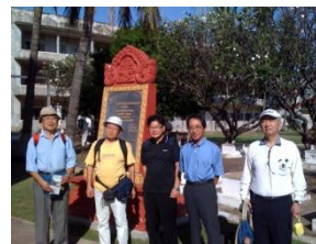
連日のように猛暑でしたが、参加の皆さんには、大変満足いただけたようでした。

おかげさまでもちまして、これまでに90人以上の方々が「いいね！」を押してくれました。より多くの方々が遊びに来てくれることを楽しみにしています。コメントなども残していただけたら嬉しいです。お返事100%を目指しています。 http://www.facebook.com/ciesf 「いいね！」をお願いします。