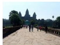
世界遺産アンコールワット