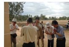
カンボジア式の挨拶

カンボジアでも現地のNGOで働く有志の方々のために義援金を集めるチャリティイベントを開催し、CIESFカンボジアスタッフも参加しました。