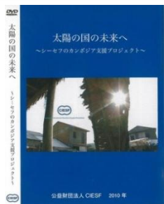
「太陽の国の未来へ-シーセフのカンボジア支援活動-」

熱帯の太陽がキラキラ照りつける中、大きな機材を抱えたディレクターさんとカメラマンさんが、ブノンペンとプレイベンに約1週間滞在し、仕上げてくださった作品です。タイトルは「太陽の国の未来」